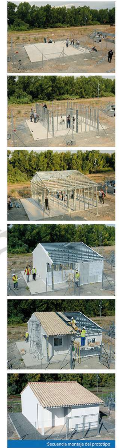
Secuencia montaje del prototipo Prototype assembly sequence

Within the last day the interior doors, sanitary and taps, as well as mechanisms and lights will be placed. In 6 days the Hi-SELF housing is ready to be inhabited.